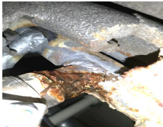
протечка на вводном кране

Постановлением Правительства РФ от 13.08.2006 N 491 утверждены «Правила содержания общего имущества в многоквартирном доме».